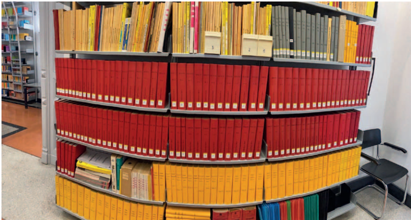
Abb. 3 + 4: Berliner Telefonbücher (ab 1949) im Lesesaal der Bibliothek. Zur Erläuterung: graue Bände = Ost-Berliner Bestand von 1955 bis 1989, die Reihe darunter West-Berlin, dieselbe Zeit.